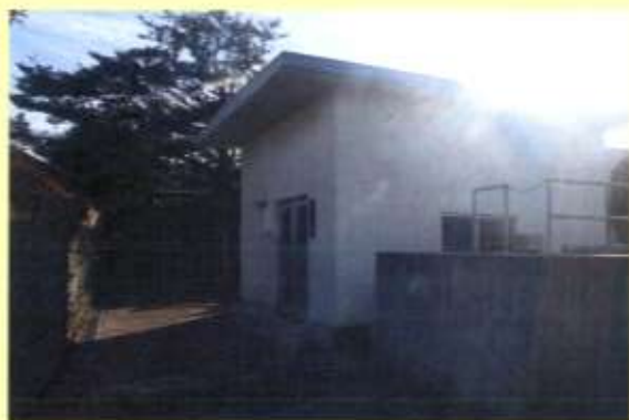
【管理施設の整備補修に】

土地改良施設に係る維持管理（整備補修）に対しては、国の補助事業により一定の助成が行われており、事業に必要な経費のうち、国等の補助金以外の受益者が負担する部分（分担金といいます。）については、農業基盤整備資金の融資対象となっています。また、土地改良区等が国の補助を受けないで行う土地改良施設の整備補修についても幅広く農業基盤整備資金の融資対象としているほか、土地改良区の事務所建設に要する費用や事務機器、巡回用車両の購入等についても、融資を受けることができます。