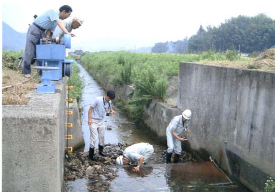
転倒ゲートの調査・点検

農業基盤整備資金は、土地改良区などが行う土地改良施設の維持管理事業に対して、用排水路や農道などの補修は勿論のこと、土地改良区の事務所の建設、事務機器や巡回用車両等の購入など、維持管理事業のあらゆる用途に幅広くご利用頂けます。