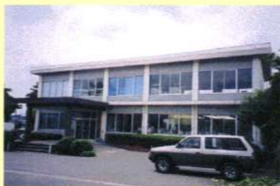
【土地改良区事務所の新增築に】