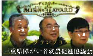
取組紹介のPR動画(グランプリ地区)