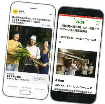
メディア媒体(アウモ、ソトコト)での記事掲載