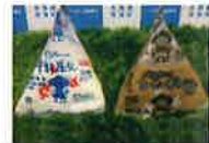
日本テレビ ZIP にて商品紹介