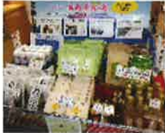
アンテナショップでのイベントコーナー

「ディスカバー農山漁村の宝」に選定された地区に対しては、特設 Web サイト等で活動を紹介するほか、PR 動画の制作、アンテナショップでのイベント出展支援、メディア媒体での記事掲載など、全国へ幅広く発信しています。