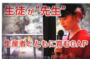
特設 Web サイト内取組発表ページ