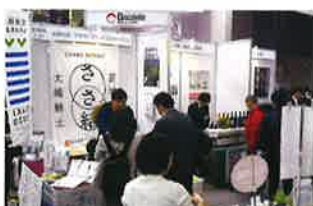
アグリフード EXPO 大阪 (令和2年2月)