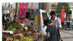
軽トラによる移動販売