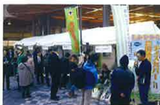
東京の有楽町におけるマルシェ (令和元年12月)

「ディスカバー農山漁村の宝」に選定された地区に対しては、選定証の授与を行います。また、農林水産省ホームページ等で活動を紹介するほか、様々なイベントへの出展支援を通じて、全国的な情報発信を行います。コロナ禍における第7回選定では、選定地区の地域産品や取組を特設ウェブサイト内で紹介し、全国へ幅広く発信しました。