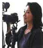
織作峰子 大阪芸術大学教授 写真家